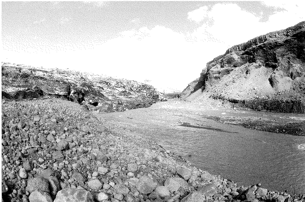
Öldufellsjökull við Axlir. Ljósmynd: Jón Jónsson, 30 ágúst, 1984.