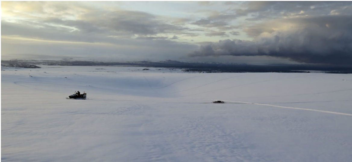
Finnur Pálsson mælir síðustu ísþykktarmælilínuna yfir syðsta hluta ketilsigs sem myndaðist í fyrstu viku september 2014 um 4 km frá jökulsporði Dyngjujökuls. – Radio echo sounding survey of the northern most of the three cauldrons that formed in the first week of September 2014. 4. júní 2015.